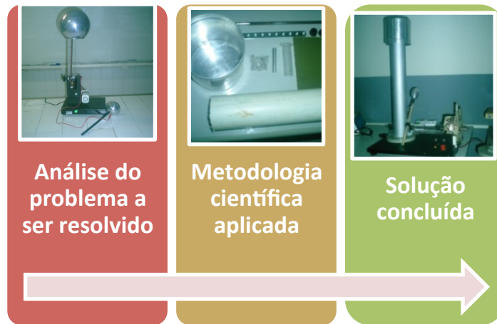
FIGURA 2. Etapas analisadas no experimento.

É importante ressaltar que há restrições quanto a utilização de materiais semelhantes aos listados a cima, entre elas as mais comuns que acabam acarretando no mau funcionamento de geradores de Van Der Graaf construídos em laboratório: