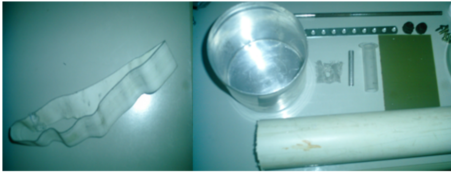
FIGURA 3. Materiais de baixo custo utilizados para construção do Gerador de Van Der Graaf.

As escovas são acopladas de maneira a ficar próximo o suficiente para ocorrer o efeito corona, a superior conecta-se ao pote de alumínio, que funciona como cúpula, e a inferior conecta-se ao aterramento. A base de madeira é responsável por evitar que a vibração do motor desestabilize experimento.