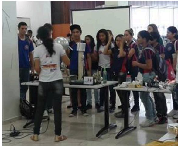
FIGURA 5. Apresentação do gerador de Van Der Graaf para alunos do nível médio.

participarem do curso ofertado pelo Programa de Extensão Laboratório de Engenhocas da Universidade Federal do Pará Campus Tucuruí.