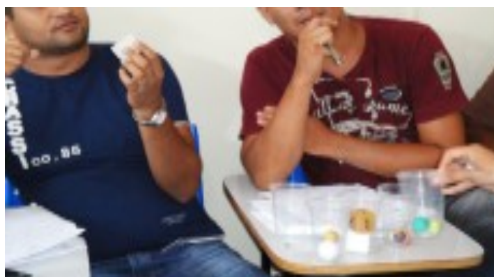
FIGURA 6. Fazendo previsões para o comportamento de objetos sólidos em água.

Cada grupo recebeu um copo com os objetos previamente organizado (Figura 4). Cada participante do grupo foi orientado a fazer suas previsões para o comportamento em água dos objetos presente em cada copo. Assim, recebiam os copos, pegavam nos objetos e faziam as anotações de suas previsões (Figura 6). Em seguida, recebiam outro copo e faziam as previsões com relação ao comportamento daquele conjunto de objetos presentes no copo recebido.