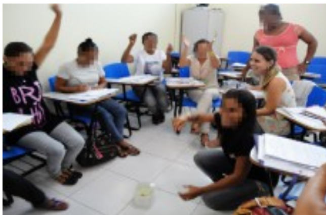
FIGURA 7. Testando o comportamento dos objetos em água.

Depois que todos os grupos realizaram os testes foram orientados a discutir sobre suas previsões e observações. A seguir apresentamos os resultados das previsões e observações do experimento de cada copo da sequência.