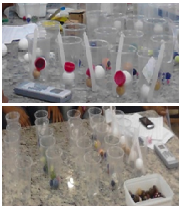
FIGURA 2. Possibilidades de sequencias organizadas para o estudo da noção de densidade.

Uma informação que complementa a referida compreensão é apresentada quando objetos constituídos de mesmo material são apresentados em volume diferente, como por exemplo, objetos constituídos de parafina. A atenção a objetos constituídos de mesmo material e de materiais diferente conduziu o grupo, em conjunto com a professora, a pensar na organização de um sequencia que pudesse disponibilizar os diferentes objetos segundo alguma semelhança. Na Figura 2 temos exemplos de algumas possibilidades pensadas pelo grupo.