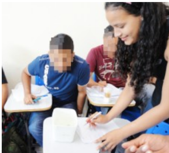
FIGURA 5. Grupo participante da oficina em orientação.

Os participantes da oficina foram organizados em 4 grupo. Cada grupo foi orientado por um estudante de graduação que participou da construção da oficina a como proceder ao receber os diferentes objetos.