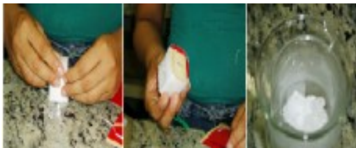
FIGURA 3. Confeção de cubo de parafina.

Na Figura 4 apresentamos a sequência que foi elaborada. Ela é formada por sete grupos de objetos. Estes estão organizados dentro de copos que foram numerados de 1 a 7. No copo 1, temos objeto (bolinhas maciças) com mesmo volume constituídas de materiais diferentes (massa de modelar e aço). No copo 2, temos objetos (cubos) com mesmo volume, constituídos de materiais diferentes (isopor, parafina e madeira). No copo 3, temos três objetos (dado de plástico, peteca de vidro e bolinha de borracha) com volumes diferentes, constituídos de materiais diferentes. No copo 4, temos objetos (bolas maciças) de volumes diferentes, constituídas de materiais diferentes (madeira e isopor). No copo 5, temos objetos (bolas maciças) de diferentes tamanhos constituídas de um mesmo material. No copo 6, temos objetos (cubos) de diferentes tamanhos constituídos de um mesmo material. No copo 7, temos objetos de volumes diferentes constituídos de diferentes materiais, mas que possuem mesma massa.