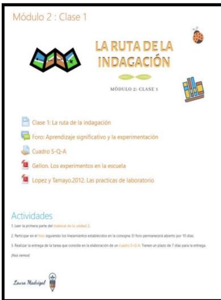
FIGURA 2. Diseño de uno de los módulos, correspondiente a la clase 1.

La propuesta de curso virtual, está diseñada para ejecutarse en “Moodle”, con un diseño sencillo de manejar, como se muestra a continuación: