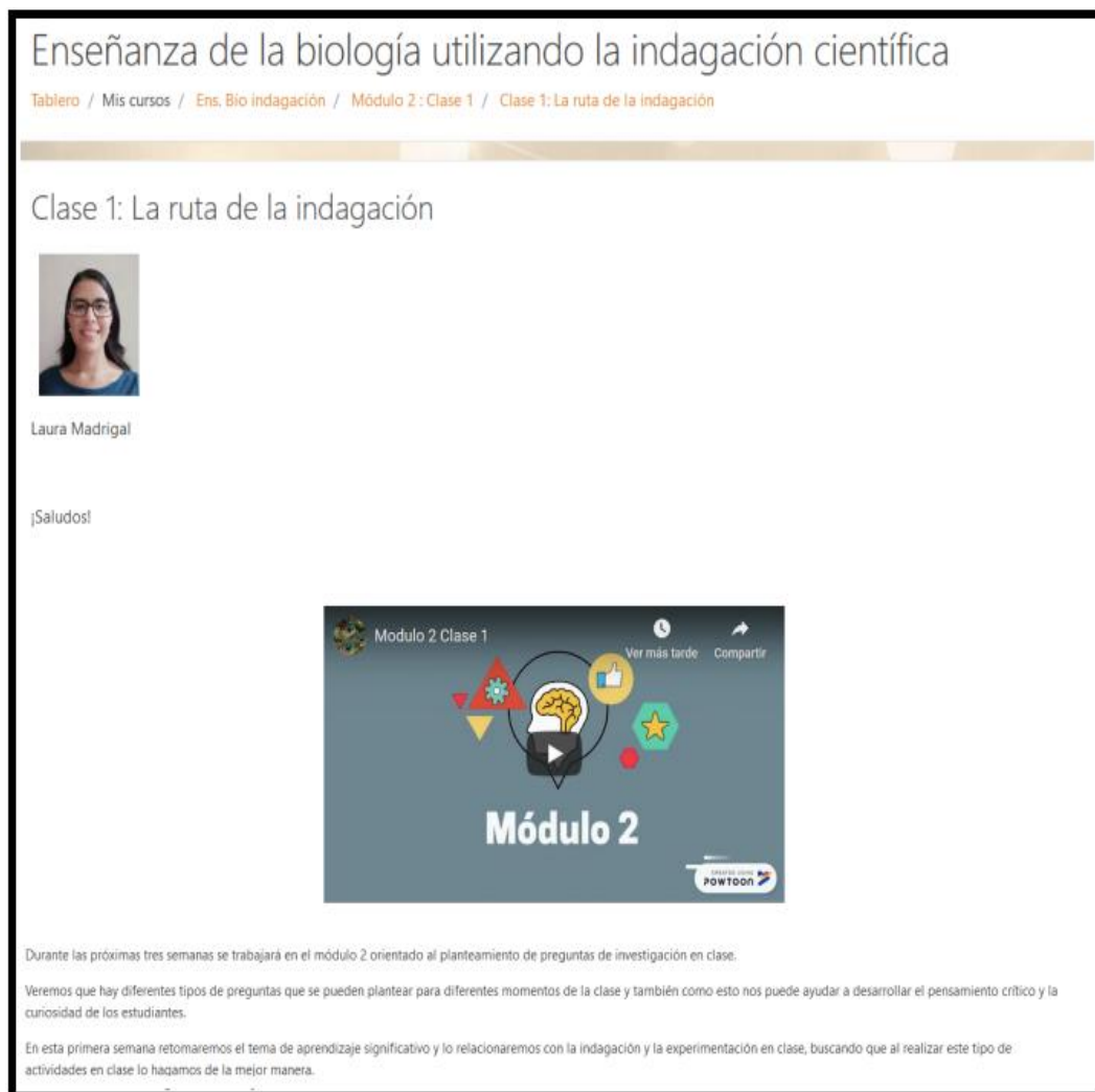
FIGURA 3. Diseño de una de las clases (parte de la clase 1).