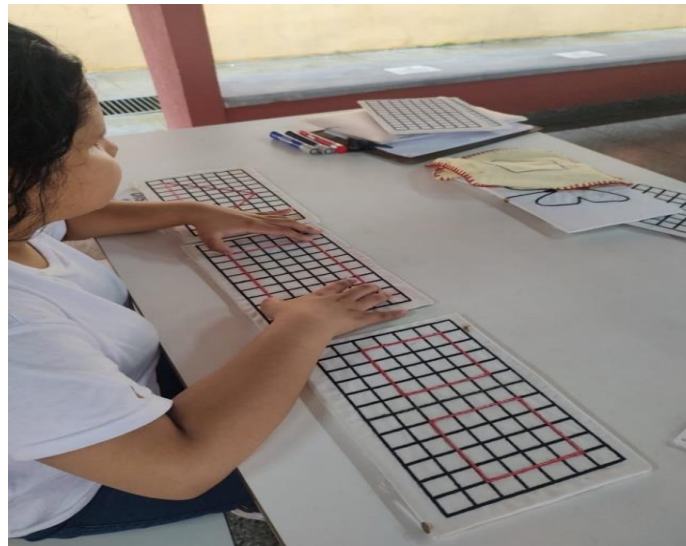
FIGURA 4. Expõe a atividade de translação, por meio desta pesquisa se obteve uma contribuição significativa para se obter resultados na pesquisa desenvolvida, tanto para a aluna como para o pesquisador. Por fim desta atividade, foi feito com a aluna uma atividade para que a mesma identificasse qual polígono estava manuseando, e o pesquisador se surpreendeu com o resultado obtido, a qual ela descreveu com exatidão cada forma geométrica plana. É importante propor atividades que proporcionem ações de classificação, ordenação e comparação de objetos, formas e figuras. Para os alunos com múltiplas deficiências, exercícios de comparação e classificação facilitam o processo de comunicação e aprendizagem, aumentando o desenvolvimento cognitivo (BRASIL, 2006).