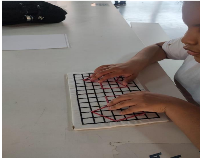
FIGURA 3. Relata a atividade de translação, na qual propôs-se a atividade que representariam as imagens e através do material adaptado foi possível o reconhecimento sobre o conceito de translação (figura 6). Cabe ao professor, conduzir o seu grupo de alunos a compreender o conteúdo planejado, em diferentes conceitos, criando situações em que eles interajam e discutam, buscando a aprendizagem (BRASIL, 2001).